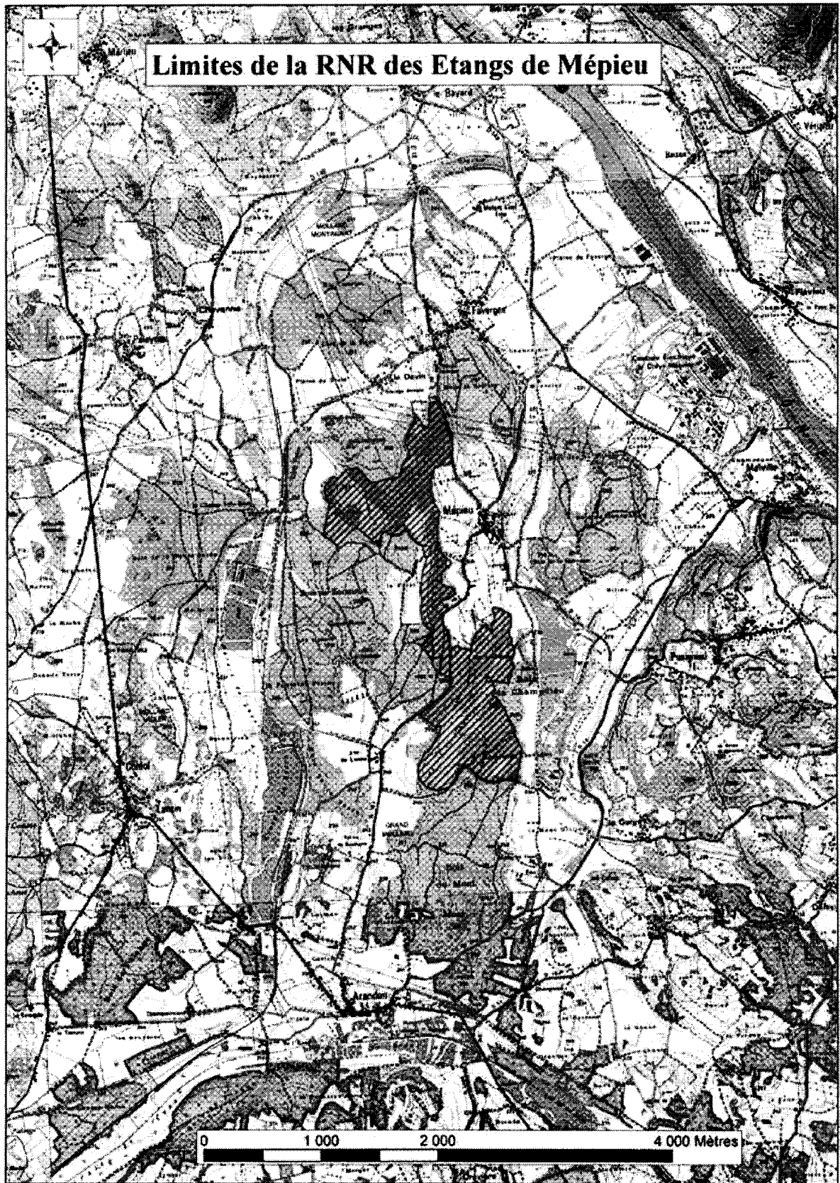
Carte de situation de la RNR des étangs de Mépieu