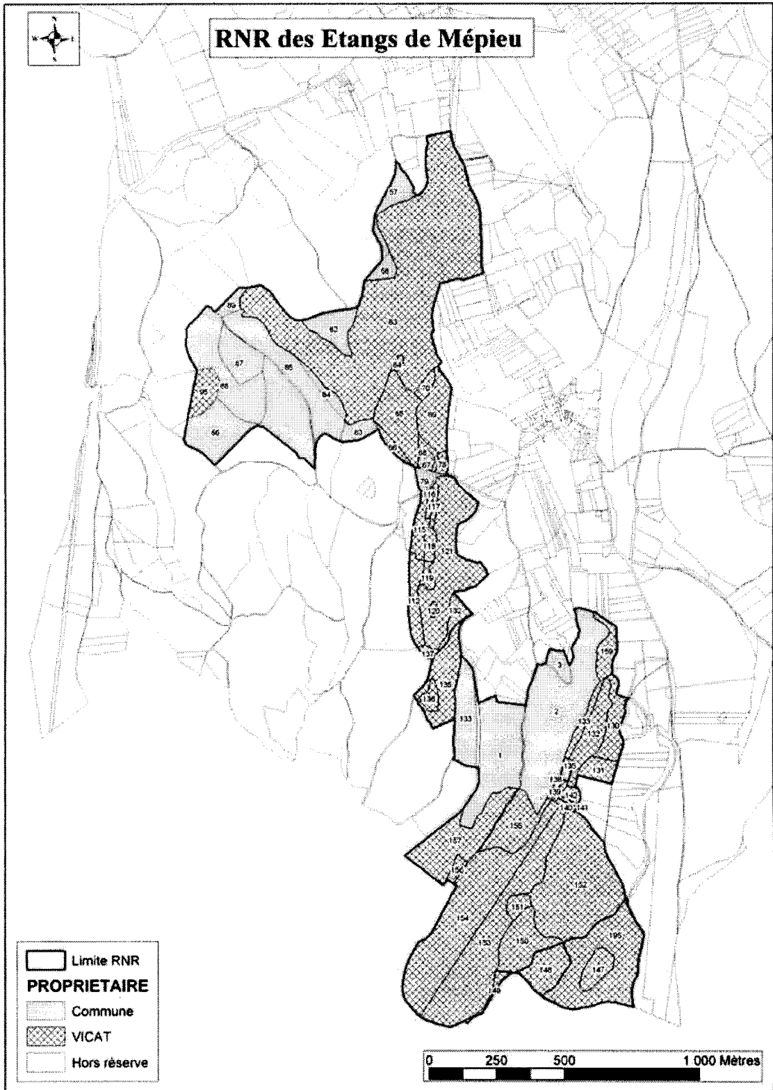
Carte de localisation des propriétés de la RNR des étangs de Mépieu (fond cadastral commune de Creys-Mépieu)