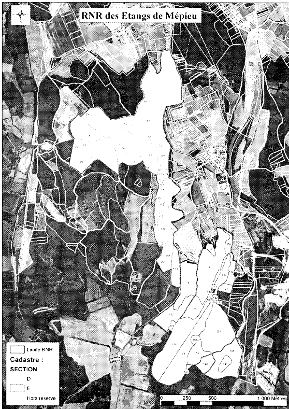
Carte des limites cadastrales de la RNR des étangs de Mèpieu (fond BD ortho 2003 - IGN + fond cadastral commune de Creys-Mèpieu)